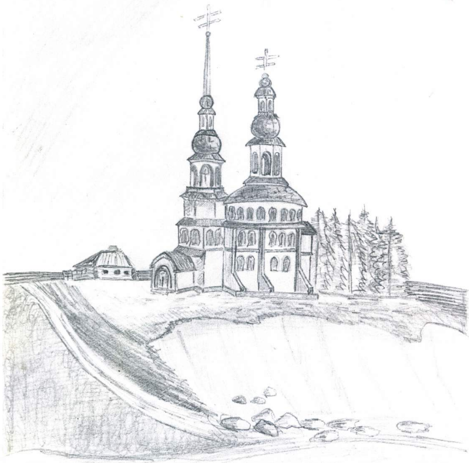
Сухобузимская Троицкая церковь с фотографии 1935 года. Рис. Лавейкиной М., уч-ся 10 «А» класса МКОУ «Сухобузимская СШ». ВКС 2017 г.